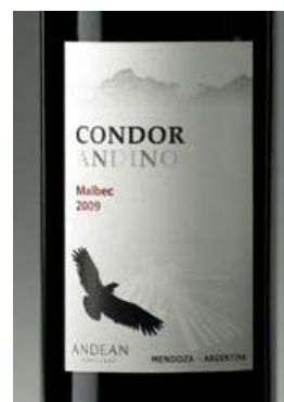
<コンドルをモチーフにしたラベル>

世界のワイン生産者上位7位に入る生産者グループに属する「アンデアン・ヴィンヤーズ」が醸造した、マイワインクラブのPBワイン。アンデス山脈に生息するコンドルの姿をモチーフにした印象的なラベルで、アルゼンチンの大地で育ったぶどうの伸びやかな果実味が楽しめるというコンセプトを表現しています。