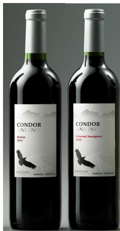
『コンドール・アンディーノ』

今回、その第一弾として、熟成した味わいが楽しめる『コンドール・アンディーノ赤2種6本セット』と、夏にぴったりな『コンドール・アンディーノ白2種6本セット』を、各4,980円（1本あたり830円）という低価格で販売します。どちらも日本では当社のみが独占輸入いたします。