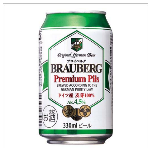
ドイツ産プレミアムビール『プロイベルグ ビール』

株式会社ベルーナ（本社：埼玉県上尾市／代表：安野 清）が展開するワイン専門通販「My Wine CLUB（マイワインクラブ）」では、日本初上陸のドイツ産プレミアムビール『プロイベルグ ビール』と、ドイツ産の本格ノンアルコールビール『ベッカーズ ノンアルコールビール』を5月21日より販売開始しました。