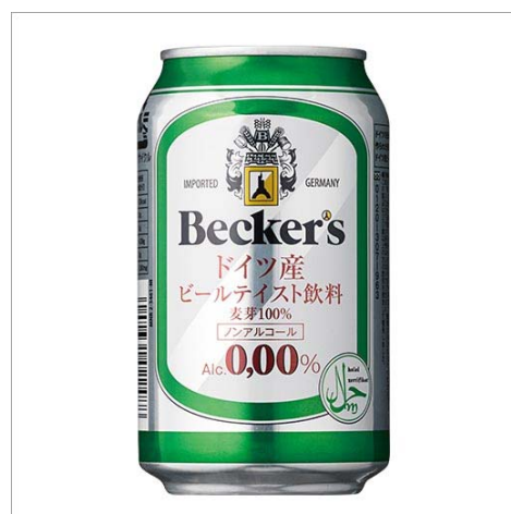
『ベッカーズ ノンアルコールビール』

マイワインクラブは、輸入ワインを中心に世界各国のワインを販売するワイン専門通販です。直輸入ならではのお手頃な価格と毎月定期的にお届けする頒布会が支持を得ており、6年連続でワイン通販国内売上高 No.1*となっています。※東京商工リサーチ調べ 2008年度～2013年度実績