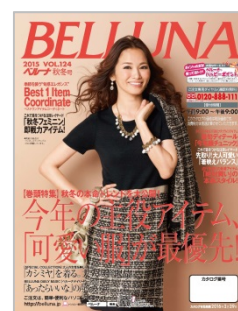
『BELLUNA 2015 秋冬号』