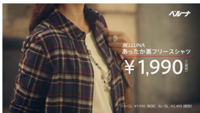
TV-CM「あったか裏フリースチェック柄ロングシャツ」

『あったか裏フリースチェック柄ロングシャツ』は、裏が全面フリースとなっており、シャツでありながら驚きの暖かさを実現しました。流行のチェック柄とロング丈で、おしゃれと暖かさが両立した寒い季節に活躍すること必至のアイテムです。販売開始から予想を大幅に上回る注文が来ており、今シーズンの大ヒット商品となっています。