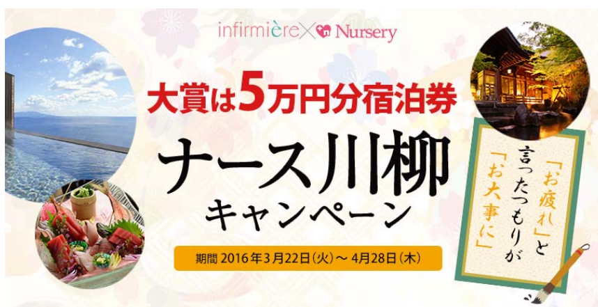
<看護の日特別企画>最大5万円分のクーポンプレゼント！ナース川柳キャンペーン

株式会社ベルーナ（本社：埼玉県上尾市、代表取締役社長：安野 清）の子会社である株式会社アンファミエ（ http://www.lemoir.com/top/nurseTop.jsp ）と株式会社ナースリー（ http://www.nursery.co.jp/ ）が展開する看護師向け通販サイトでは、5月12日の「看護の日」を記念して「ナースあるある」川柳を募集するキャンペーン「ナース川柳キャンペーン」を3月22日（火）～4月28日（木）まで実施いたします。