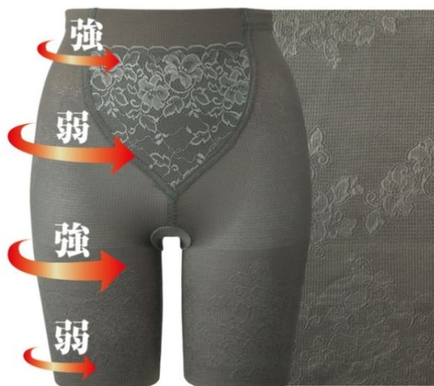
<生地締め付け強弱でサポート イメージ図>

『エステのように包み込むガードル』は、きつく締め付けることで補整するパワーネットを一切使わず、生地の編み方で圧力を変え、引き上げてサポートすることを実現させた新発想のアイテムです。