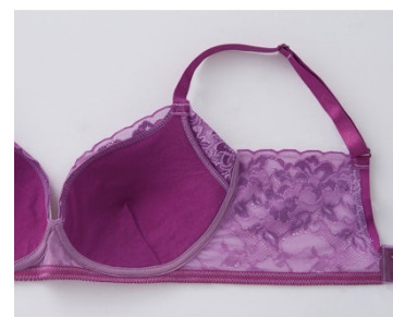
<サイドベルト 段階着圧オリジナルレース>