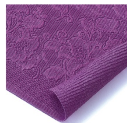
<パイル生地 拡大画像>