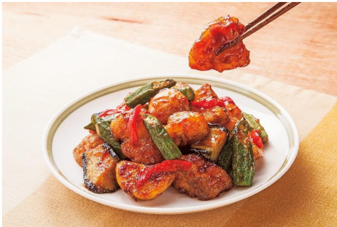
<いつでも超速10分おかず kit>毎月4,980円(税抜) 調理イメージ

株式会社ベルーナ(本社：埼玉県上尾市、代表：安野清)が展開するグルメ専門通販「ベルーナグルメ友の会」( https://belluna-gourmet.com/ )は料理キットブランド「NICOMOG (にこもぐ)」を設立。春号にて冷凍料理キット「いつでも超速10分おかず kit」を発売いたしました。