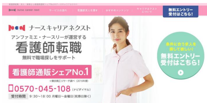
<ナースキャリアネクスト サイト>