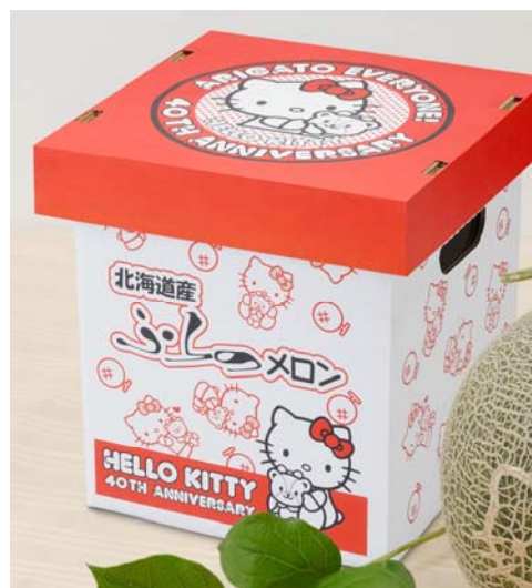
<40周年特別ボックス>

最近ではカジュアルギフトの需要が伸びており、ベルーナグルメ友の会では、身近な人へのプレゼントとして利用しやすいよう、昨年から名称を「お中元」から「夏のギフト」に変更しました。ベルーナグルメ友の会の「夏のギフト」では、今年もメロンの網目がキティちゃんの柄になった『ふらのキティメロン』（税抜5,000円）を販売します。今回は、ハローキティ生誕40周年を記念して、40周年特別ボックス入りの『ふらのキティメロン』をインターネット限定で400個販売いたします。