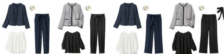
【テーパードパンツ】 ネイビー系