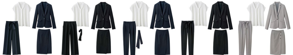
【ワイドパンツ】 ネイビー系