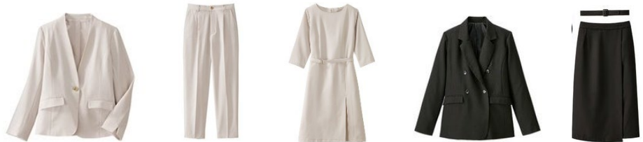
【ノーカラー】 ベージュ