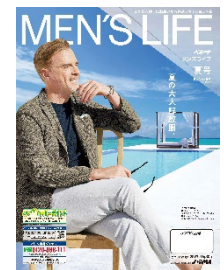
メンズライフ夏号