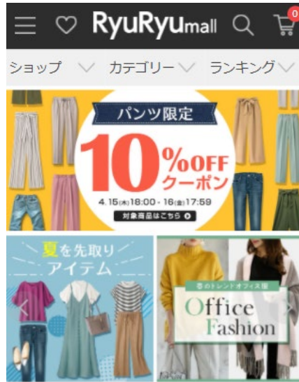
RyuRyuモール (PCサイト・スマートフォンサイト)