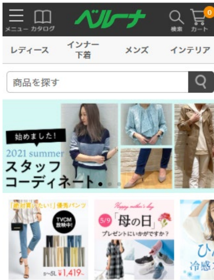
ベルーナネット (PCサイト・スマートフォンサイト)