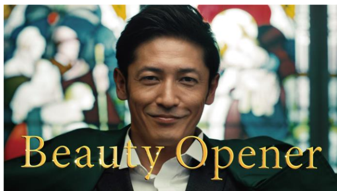
放映中TVCM 「ビューティーオープナージェル」