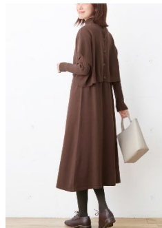
2点セットニット ワンピース

https://belluna.jp/02/010101/shop/violaeviola/vi11/index/