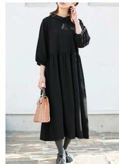
【防シワ】 お家で洗える！ 2WAYギャザー切替 ワンピース