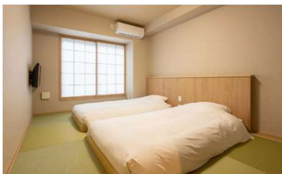
▲スーペリアツインルーム

ファンゲートホテルでは、宿泊に特化した高い利便性と快適性を追求しています。一人旅やビジネス、ご夫婦・ご友人とのご旅行まで、あらゆる用途に寄り添うスマートな拠点として、心地よいひとときをお届けします。