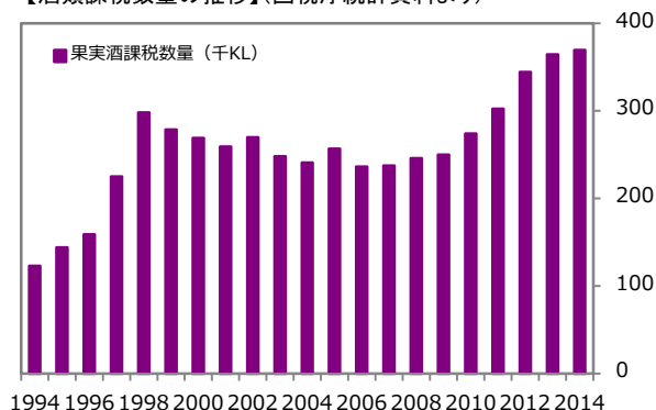
【酒類課税数量の推移】(国税庁統計資料より)