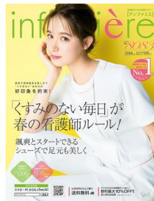
<アンファミエ 春号>