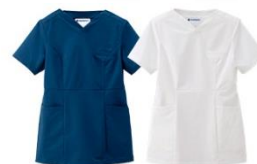
女性らしいサイジングの洗練スクラブ