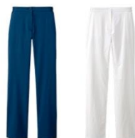
ライン美。機能美。オ色兼備ストレート