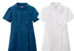
知的で女性らしい新型ケーシー