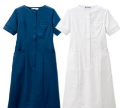
美しく働く人の極上シンプルワンピース