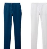
しなやかフィット感のストレスフリースリム