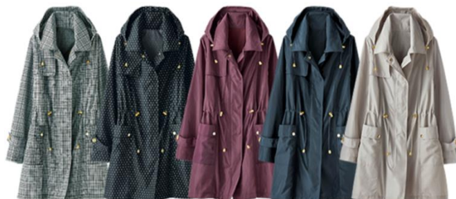
＜グレンチェック、ドット、ワイン、ネイビー、ライトグレー＞

商品名 : 雨の日もおしゃれに！はっ水加工コート サイズ/価格 : M~LL 3,990 円(税別) 3L~4L 4,990 円(税別) 色 : グレンチェック、ドット、ワイン、ネイビー、ライトグレー 特長 : 雨の日にも大活躍する、はっ水加工を施したコート。トレンド感漂う、ゴールドジッパー使いがポイントです。デザイン性と機能性を兼ね備えた優秀コート。背裏部分がメッシュ素材になっており、蒸れにくいのも魅力。