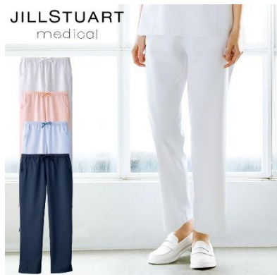
パンツ : 4 サイズ 価格 : 5,940 円(税込) 素材 : ダイアゴナル