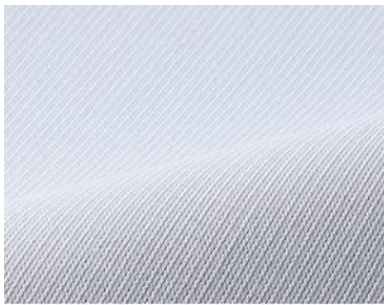
コードストライプ

非常に細かいストライプ柄は、遠目で見ると無地のようにも見える洗練されたトラディショナル。ソフトなハリ感が心地よく、いつでも爽やかな肌ざわりを感じられます。