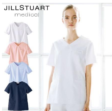
スクラブ : 4 サイズ 価格 : 6,372 円(税込) 素材 : ダイアゴナル