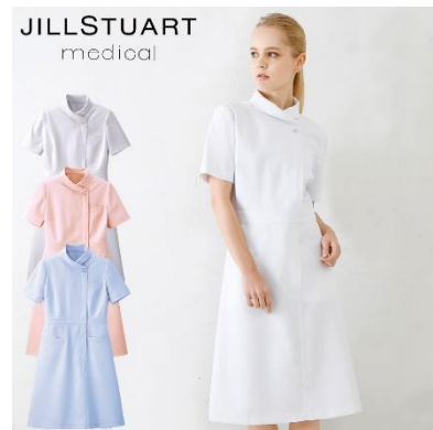
ワンピース : 4 サイズ 価格 : 8,532 円(税込) 素材 : ダイアゴナル