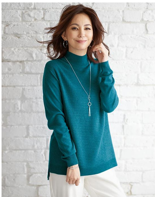
＜乾燥機まで OK！メランジニットプルオーバー＞ ￥1,990 ～ ￥2,990（税別）

株式会社ベルーナ（本社：埼玉県上尾市／代表：安野 清）が展開する大人の女性向け通販ブランド「BELLUNA（ベルーナ）」（ https://belluna.jp/ ）は春号にて「乾燥機まで OK！メランジニットプルオーバー」を発売しました。