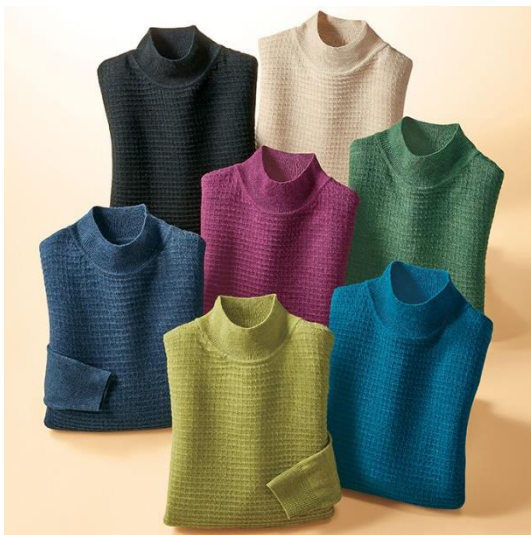
<カラーバリエーション>

特長：洗濯機で洗えるだけでなく、乾燥機にかけても縮みにくいメランジ調ニット。気になる腰まわりをさりげなく隠せる長さでデザインです。サイドスリット入りですっきりとした印象に。