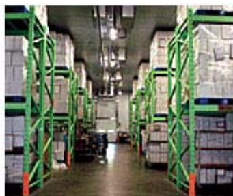
ワイン専用の倉庫を保有

ワインは保存状態でも品質が左右されるデリケートな飲み物です。そこで「My Wine Club」では、全てのワインを完全に遮光されたワイン専用の倉庫で大切に保管し、ワインの大敵である温度変化、乾燥、光から守っています。専用倉庫内の室温は高級ワインで 12℃、それ以外は 15℃の 2 つの温度で管理しています。湿度も 70~80% をキープしています。また、夏場 (6 月~8 月※9 月は残暑の様子を見て常温便への切り替えを行います) には僅かな移送時間でも、必ず「冷蔵便」でお届けします。お客様のお手元に届くまでワインの状態は万全です。