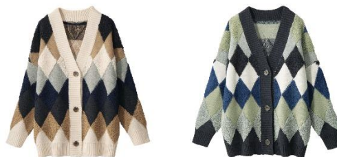
<アイボリー系、チャコール系>

特長：もこもことした編地とトレンドのアーガイル柄で価値観たっぶりのニットカーディガン。ゆったりめのシルエットで秋の軽めのアウターとしても活躍しそう。