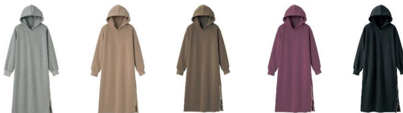
<杳グレー、モカベージュ、ブラウン、バイオレット、ブラック>

特長：着回し力抜群で毎日着たくなるアイテムです。トレンドのドロップショルダーのゆったりシルエットで簡単に今ドキコーデが完成！あったか裏起毛素材のため、ロングシーズン着用でき、今年の秋冬の強い味方になってくれること間違いなし。