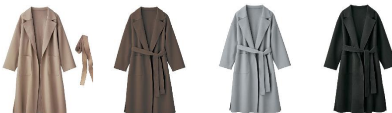
<ベージュ、ブラウン、ブルー、ブラック>

特長：サラッと羽織るだけで高見え&今っぽさ抜群！軽いのにあたたかく上品に魅せる、ふんわりとしたウールライク素材のロングチェスターコート。表裏両面起毛の1枚仕立てで柔らかく、カーデ代わりとしても便利なアイテムです。ドロップショルダーが女性らしく華奢に着こなせます。