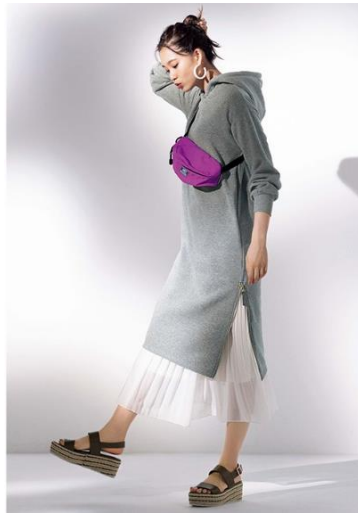
＜裏起毛裾ファスナーパーカーワンピース 1,990 円（税別）＞

今回は、各カテゴリーから新作アイテム計 3 点をピックアップ。トップスは「アーガイルニットカーディガン」、ワンピースは「裏起毛裾ファスナーパーカーワンピース」、アウターは「オーバーサイズチェスターコート」となります。中でも今季特にオススメのアイテムとして、累計販売枚数 4.8 万枚を突破した（2020 年 9 月時点）着こなし抜群の優秀ワンピース「裏起毛裾ファスナーパーカーワンピース」の特長やポイントをご紹介します。