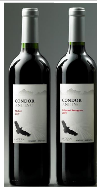
マイワインクラブ PB ワイン 『CONDOR・アンディーノ』