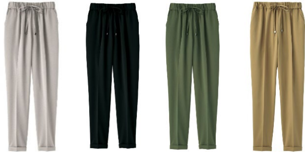
(左より) ライトグレー、ブラック、カーキ、ベージュ