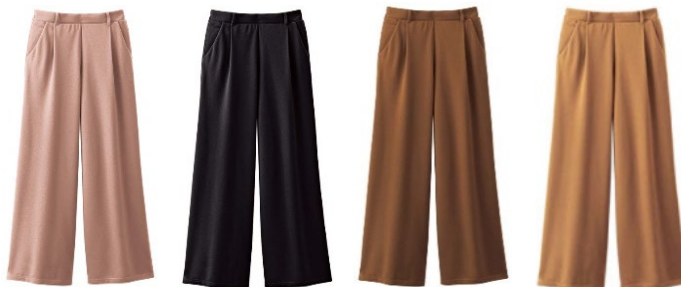
(左より) グレイッシュピンク、ブラック、ブラウン、キャメル