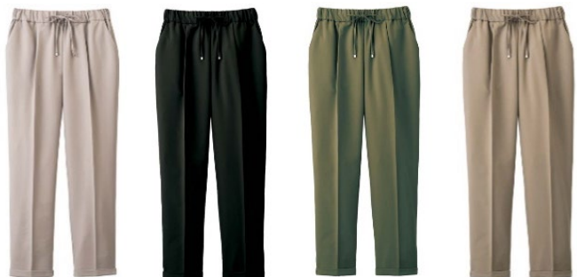
(左より) ライトグレー、ブラック、カーキ、モカ