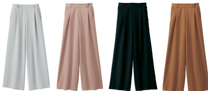
(左より) ライトグレー、グレイッシュピンク、ブラック、キャメル