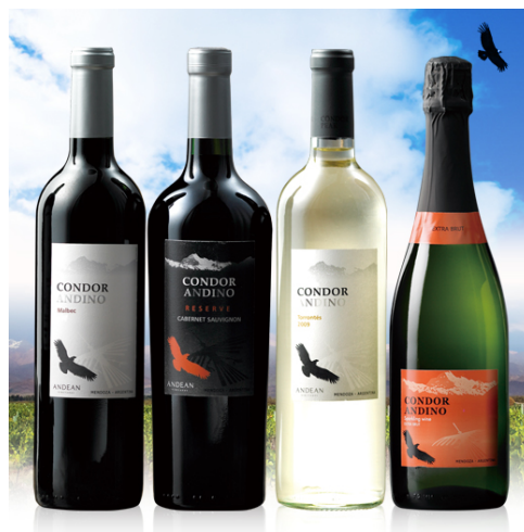
PB ワイン「コンドル・アンディーノ シリーズ」