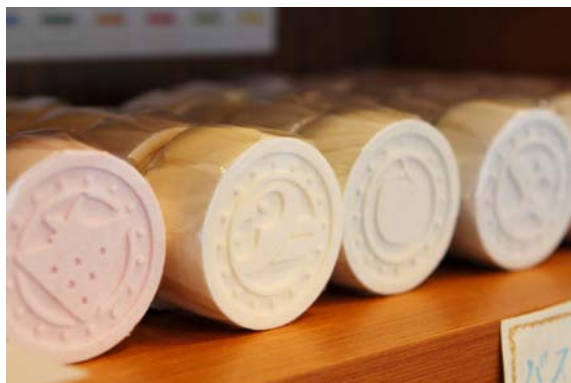
<地球村のバスボム>

11月のスタートに向けて、既に4000個のバスボムが発注され、工房地球村ではその生産が急ピッチで進んでいます。現場では、月産製造数をこれまでの倍にして対応しており「これまで製造したことのないスタッフも担当するようになり製造できるスタッフが増えた」という声や「忙しいけれど、4000人のお客様が待っていると思うと嬉しくなるし、頑張れる」という声も聞かれ、製造技術の獲得や働きがいなどの効果が既に見え始めています。