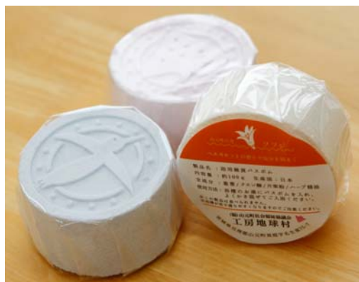
<ノベルティのバスボム>

ベルーナグループでは、看護師向けの通販事業を強化しており、今回、国内で唯一最大の精神科看護師の職能団体である日精看と協同で取り組むことによって、看護師事業のさらなる拡大を図るとともに、精神障害者の社会参加の推進に寄与してまいります。