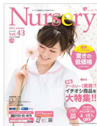
<Nursery 13 秋号>