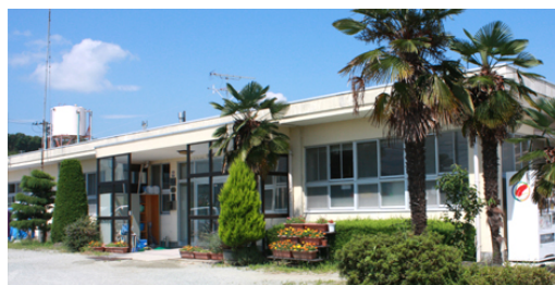
<山元町共同作業所「工房地球村」>