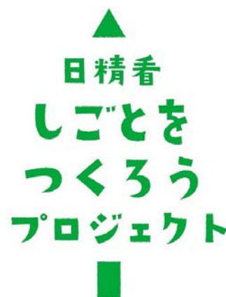
<プロジェクトのロゴ>

看護師は白衣やシューズなど主に職場で使用するアイテムに年間平均2万円を消費しているとされ、その購入シーンでは日常的に通販カタログが利用されています。このプロジェクトは、看護師が日常的に利用するサービスに組み入れる事によって、精神科看護師が参加しやすい形で提供します。また、ナースリーと工房地球村が単なる支援ではなく、商品（バスボム）を購入しその対価を払う“ビジネス”として実施することで、顧客満足と事業者メリットを両立させ持続可能性を高めています。