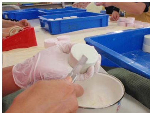
<バスボムの製造風景>