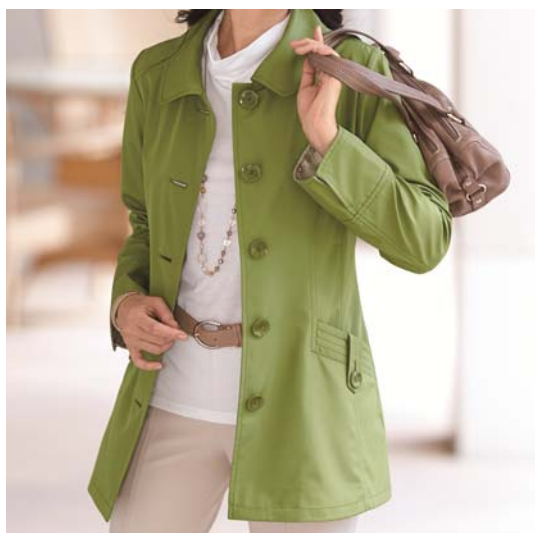
『ボンディング素材裏プリントジャケットコート』着用イメージ

おしゃれなのに機能性も備えているため、今シーズンは前年に発売した同型商品よりも約30%増の売上となっています。