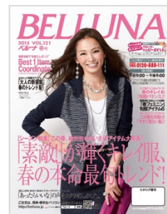
『BELLUNA 2015 春号』