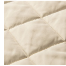
ダイヤキルティング