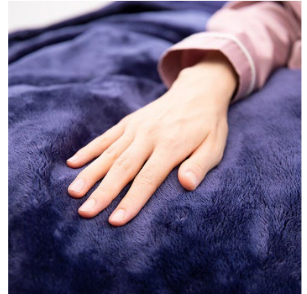
肌ざわりの良いマイクロファイバー