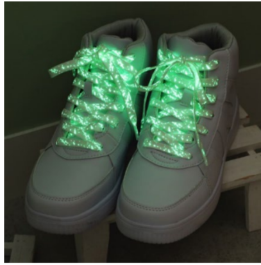
暗闇で光る蓄光仕様の靴紐