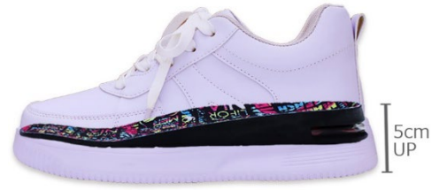
エアークッション