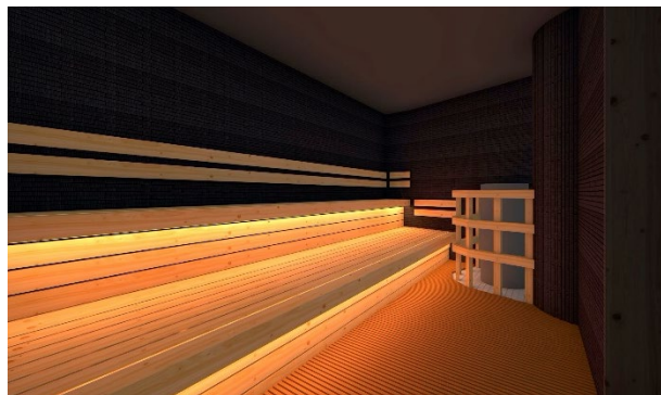
オートロウリュサウナ

数々の銭湯設計を手がける今井健太郎氏が設計した「内観へと誘う空間」をコンセプトにしたデザイン性のある温浴空間となっています。 ※女性エリアのみ