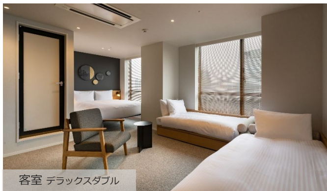
客室 デラックスダブル