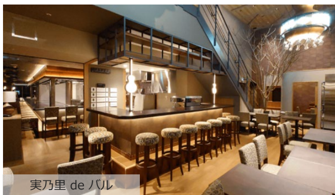
実乃里 de バル

朝食は、和食・洋食からお好みでお選びいただけるプレートに加え、パンや新鮮な野菜を使ったサラダなどbuffet形式のメニューも取り揃えています。午前7時からご利用いただけるため、ビジネス利用の方にもおすすめです。