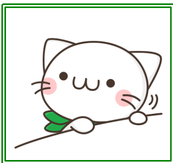
公式キャラクター「べるーにや」