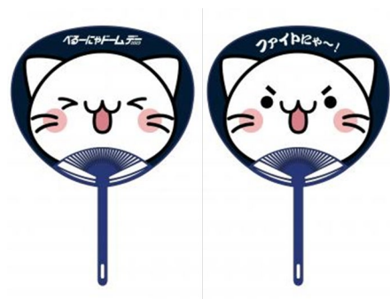
べるーにやうちわ

特典：べるーにやグッズが当たるべるーにやくじ引き（先着順） べるーにやうちわプレゼント（購入者全員） ※べるーにやくじ引きは無くなり次第、終了とさせていただきます。