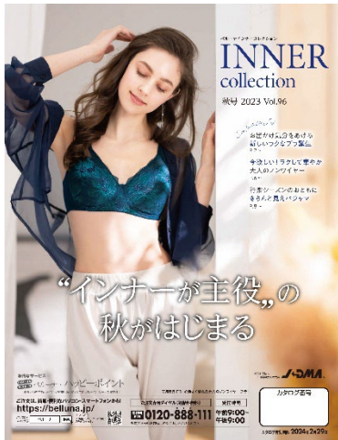
インナーコレクション 秋号