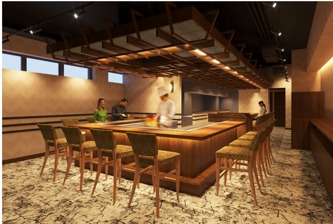
銀座のステーキ 公式WEBサイト… https://www.ginzano.jp/steak/