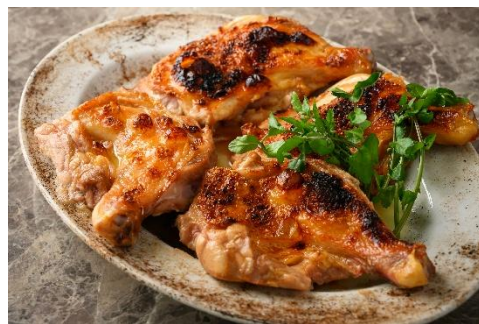
▲チキンレッグのジャパニーズテイスト