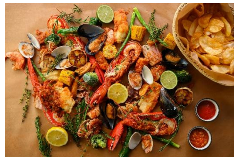
▲ KIYO特製ケイジャンシーフード