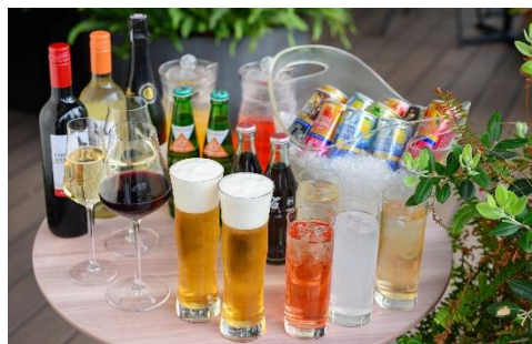
▲ ドリンクイメージ