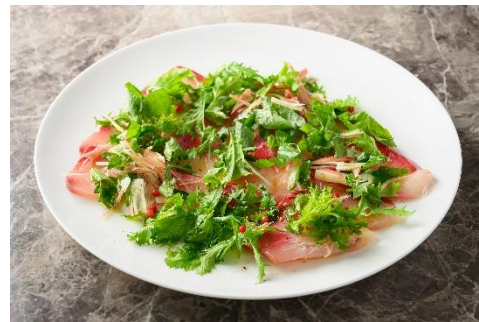
▲ブリのカルパッチョ